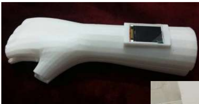
کسب مدال برنز جشنواره جهانی اختراعات توسط پژوهشگر پارک علم و فناوری گلستان