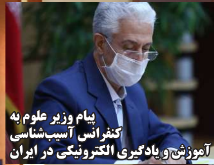
پيام وزير علوم به کنفرانس آسیب‌شناسی آموزش و یادگیری الکترونیکی در ایران

تاریخ اندیشه و شناخت علمی؛ بیش از هر واقعیت دیگر در خود شواهد و نشانه‌هایی از تحول و تغییر مستمر دارد که دیرزمانی است اندیشمندان این عرصه را به غور و بررسی فراخوانده و حاصل تلاش‌شان را در بیان ظهور و فرود آراء، الگوها و سرمشق‌های تجربه و محقق شده می‌بینیم. بی‌گمان این تطور بیش از هر چیز ریشه در مواجهه با شرایط تازه و سربرآوردن پرسش‌ها و مسائل جدید