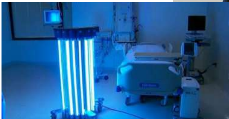
دستگاه از بین برنده و بیروس و باکتری برای اماکن عمومی تولید شد