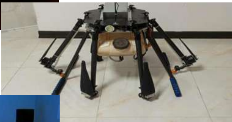
ساخت پهباد سمپاش مبتنی بر پیشرفته‌ترین فناوری‌های روز دنیا