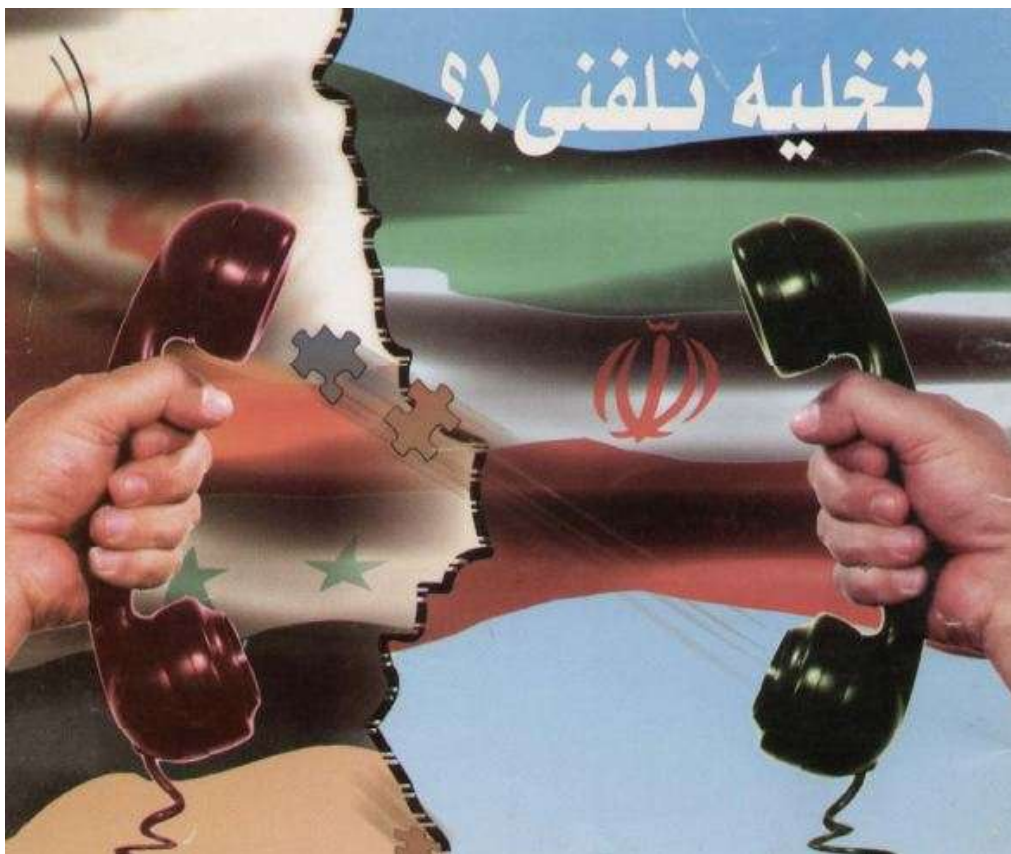
شکل های تخلیه تلفنی:

اصولاً تخلیه تلفنی به دو شکل انجام می گیرد: